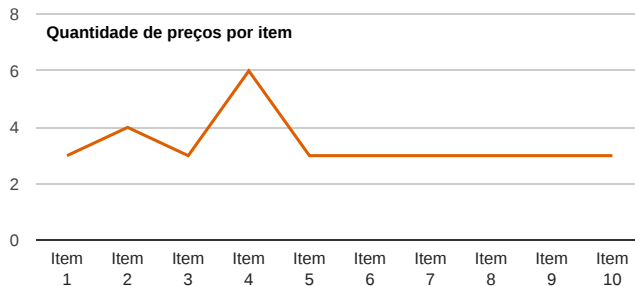
Quantidade de preços por item